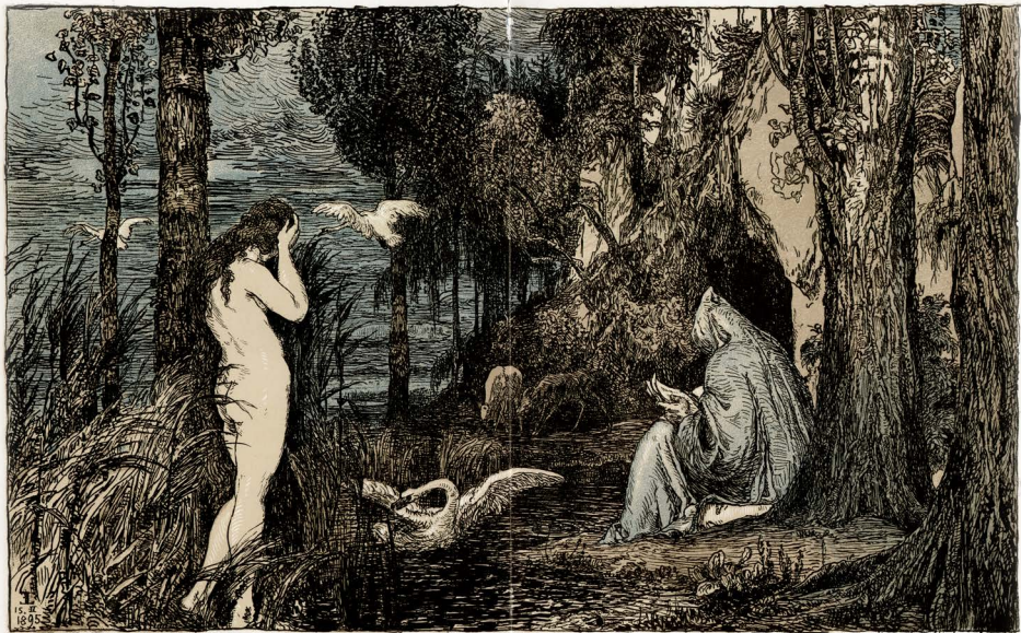
Das Märchen von den Schwanenjungfern.