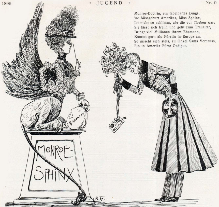
Zeichnung von Arthur Hirth.

2 Pfennig Trinkgeld geben, meinen's, sie hätten noch aufdringt! *) Wie gedenke sich der Minister zu einer solchen, den ganzen Bauernstand herabsetzenden Redeweise zu verhalten? — Der Minister: „Der geehrte Herr Vorredner möge mir die Bemerkung verzeihen, dass die von ihm beregte Angelegenheit eigentlich ausserhalb meines Ressorts fällt. Doch werde ich mich mit meinem Collegen, dem Justizminister, und mit dem Herrn Polizeipräsidenten dahin in's Benehmen setzen, dass, wenn irgend möglich, die Schliessung dieses so ausgesprochen agrarierfeindlichen Cafés verfügt werde. Ich persönlich finde es schon taktlos, ja unpassend, in solchem Zusammenhang einen Landmann, Bauer 2 zu nennen.“